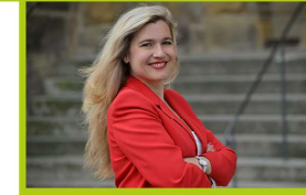
Melanie Huml (MdB) Bayerische Staatsministerin für Gesundheit und Pflege